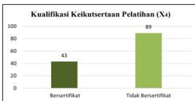
Gambar 5 Kualifikasi keikutsertaan pelatihan

Berdasarkan periode kelulusan ( X_3 ) yang disajikan pada Gambar 4 menunjukkan frekuensi lulusan SMK berdasarkan periode kelulusan yang dikelompokkan menjadi tiga kategori. Data menunjukkan bahwa lulusan baru (2022 – 2024) memiliki frekuensi terendah, yaitu 20 lulusan. Sementara itu, kelompok lulusan pandemi (2019 – 2021) tercatat sebanyak 23 lulusan, dan lulusan lama ( \leq 2018 ) memiliki frekuensi tertinggi, yaitu 89 lulusan.