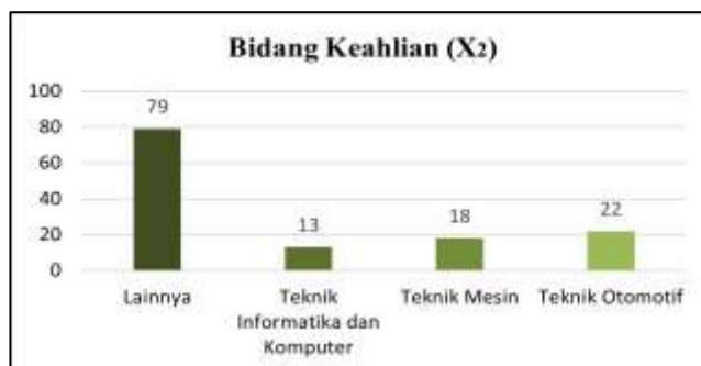
Gambar 3 Bidang keahlian

Berdasarkan jenis kelamin ( X_1 ) yang disajikan pada Gambar 2 menunjukkan bahwa frekuensi lulusan SMK yang berjenis kelamin laki-laki sebanyak 78 lulusan dan yang berjenis kelamin perempuan sebanyak 54 lulusan.