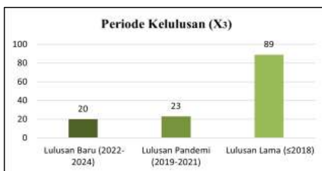
Gambar 4 Periode kelulusan

Berdasarkan bidang keahlian ( X_2 ) yang disajikan pada Gambar 3 menunjukkan frekuensi lulusan SMK berdasarkan bidang keahlian, yaitu kelompok lulusan dengan bidang keahlian lainnya memiliki frekuensi tertinggi, yaitu sebanyak 79 lulusan. Sementara itu, untuk bidang keahlian yang spesifik, terdapat 13 lulusan dari teknik informatika dan komputer, 18 lulusan dari teknik mesin, serta 22 orang dari teknik otomotif.