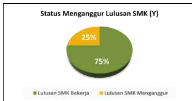
Gambar 1 Status menganggur lulusan SMK

Data dalam penelitian ini diperoleh dari Badan Pusat Statistik (BPS) Provinsi Sulawesi Selatan berdasarkan hasil Survei Angkatan Kerja Nasional (Sakernas) periode Agustus 2022, 2023, dan 2024 yang terdiri dari variabel dependen ( Y ) yaitu status menganggur lulusan SMK dan variabel independennya yaitu jenis kelamin ( X_1 ), bidang keahlian ( X_2 ), periode kelulusan ( X_3 ), dan kualifikasi keikutsertaan pelatihan ( X_4 ).