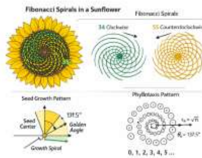
Gambar 1 Pola Spiral Fibonacci pada bunga matahari

Pola spiral pada bunga matahari memperlihatkan keteraturan matematis yang mengikuti deret Fibonacci, di mana jumlah spiral pada dua arah yang berlawanan umumnya merupakan pasangan bilangan Fibonacci berurutan. Pola ini terbentuk akibat mekanisme pertumbuhan yang mengikuti sudut emas (golden angle), sehingga menghasilkan distribusi biji yang optimal dan efisien. Fenomena ini menunjukkan bahwa matematika tidak hanya merupakan konstruksi abstrak, tetapi juga terintegrasi secara inheren dalam struktur alam.