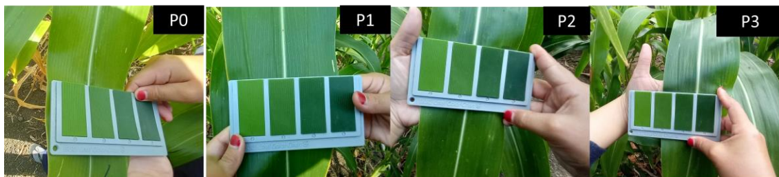
Gambar 1. Visualisasi kehijauan daun jagung pada pemberian pupuk slowrelease

Tabel 2 menunjukkan bahwa pupuk slowrelease yang diperkaya urin sapi menghasilkan ukuran stomata tertinggi yakni 108,11. Hasil ini tidak berbeda nyata dengan perlakuan kontrol dan pupuk slowrelease , akan tetapi berbeda nyata dengan pemberian pupuk slowrelease yang diperkaya urin sapi dan bakteri. Disisi lain jumlah stomata terendah dihasilkan pada perlakuan kontrol yang tidak berbeda nyata dengan pemberian pupuk slowrelease dan pupuk slowrelease yang diperkaya urin sapi. Namun hasil ini berbeda nyata dengan pemberian pupuk slowrelease yang diperkaya urin sapi dan bakteri.