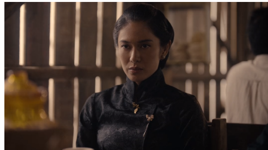
Gambar 6. Ekspresi Jeng Yah yang datar dan tanpa senyum.