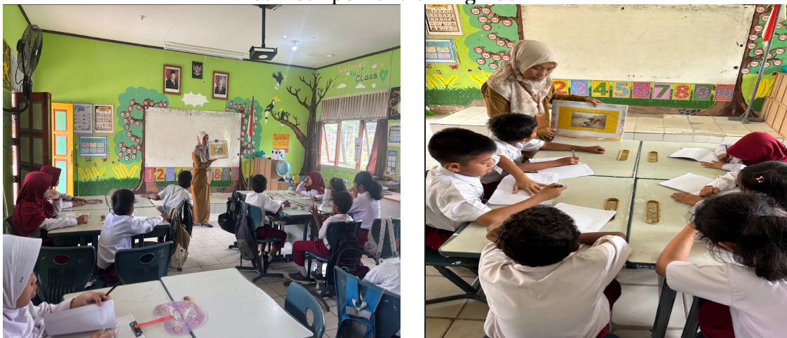
Gambar perkanalan Big Book

Berdasarkan hasil analisis penilaian diperoleh persentase sebesar 80 % dari 20 siswa memperoleh skor 80 dari skor ideal 100 sehingga dengan hasil tersebut menunjukkan bahwa dari hasil belajar yang diperoleh terlihat siswa mampu memahami pembelajaran yang disampaikan menggunakan media big book berbasis kearifan lokal yang telah dikembangkan oleh peneliti dengan baik.