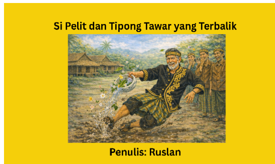
Gambar 1 Cover Big Book