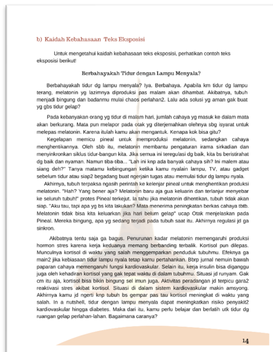
Gambar 2. Teks Eksposisi dari Thread X (tema sains)

Ini adalah bagian sampul untuk rancangan bahan ajar teks eksposisi. Bagian ini dirancang oleh peneliti dengan logo kampus merdeka, logo pendidikan, dan logo Universitas Pendidikan Indonesia (sebagai identitas peneliti). Sampul merupakan bagian yang penting untuk memikat pembaca / siswa saat akan membaca modul ini. Selain itu, ada penanda “kelas X SMA/MA/MK” untuk menunjukkan penggunaan modul ini dispesifikkan bagi anak kelas X sederajat.