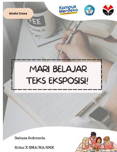
Gambar 1. Contoh Desain Sampul Modul

Ini adalah bagian sampul untuk rancangan bahan ajar teks eksposisi. Bagian ini dirancang oleh peneliti dengan logo kampus merdeka, logo pendidikan, dan logo Universitas Pendidikan Indonesia (sebagai identitas peneliti). Sampul merupakan bagian yang penting untuk memikat pembaca / siswa saat akan membaca modul ini. Selain itu, ada penanda “kelas X SMA/MA/MK” untuk menunjukkan penggunaan modul ini dispesifikkan bagi anak kelas X sederajat.