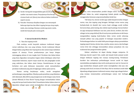
Gambar 3. Inovasi Serabi

Berdasarkan pembahasan tersebut, pemanfaatan bahan ajar berbasis budaya lokal memiliki peran penting sebagai sarana mahasiswa BIPA memahami budaya, nilai sosial, dan identitas masyarakat Indonesia. Pengintegrasian unsur budaya dalam bahan ajar dapat meningkatkan minat belajar dan juga memperkaya wawasan lintas budaya pembelajar. Hal tersebut juga ditunjukkan pada penelitian terdahulu yang mengungkapkan bahwa pemanfaatan cerita rakyat seperti “Timun Mas” berhasil mengenalkan kearifan lokal sekaligus meningkatkan pemahaman budaya pelajar asing secara signifikan (Zainy et al. , 2024). Pemanfaatan ini menjadikan bahasa Indonesia dapat dikenal dan digunakan oleh penutur asing sehingga berpotensi memperkuat pembelajaran bahasa, budaya, serta internasionalisasi bahasa Indonesia secara bersamaan.