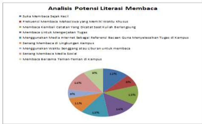
Diagram 1. Pola aktivitas Membaca Mahasiswa STAKPN-Sentani

Untuk tindakan lebih lanjut maka informasi kualitas sumber bacaan yang sering dibaca adalah Alkitab, buku bacaan yang beragam seperti buku pendidikan, teologia, musik dan sastra. Sumber lain yang sangat relevan dengan jurusan masing-masing yang diperoleh dari internet. Namun sumber yang diperoleh untuk dibaca belum beragam sehingga tersirat makna bahwa wawasan yang dimiliki masih terbatas pada ruang lingkup jurusan saja.