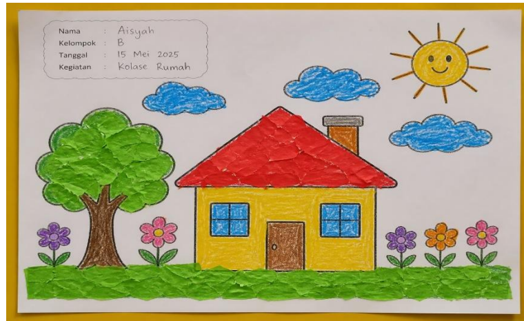
Gambar 1. Hasil Karya Anak sebagai Dokumentasi Penilaian Perkembangan

Temuan observasi memperkuat hasil wawancara, di mana guru terlihat secara aktif melakukan pencatatan perkembangan anak pada setiap kegiatan pembelajaran. Penilaian yang dilakukan telah mengacu pada indikator perkembangan yang ditetapkan dalam kurikulum, sehingga proses evaluasi menjadi lebih terarah dan sistematis. Selain itu, pencatatan dilakukan secara konsisten, yang menunjukkan adanya upaya guru dalam memantau perkembangan anak secara berkelanjutan.