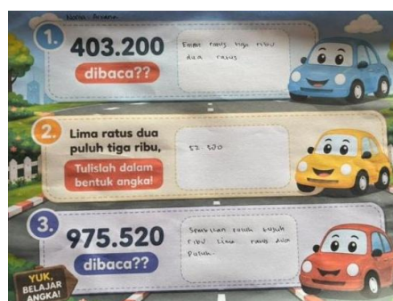
Gambar 2. Hasil Soal Siswa B

Selanjutnya, pada soal ketiga siswa A diminta membaca bilangan 975.520 dalam bentuk kata. Jawaban siswa A menunjukkan bahwa ia sudah dapat menguraikan nilai tempat bilangan secara berurutan mulai dari ratusan ribu hingga satuan. Namun demikian, masih ditemukan adanya coretan dan perbaikan tulisan pada jawaban siswa yang mengindikasikan bahwa siswa memerlukan waktu untuk memastikan ketepatan penyebutan bilangan. Secara umum, hasil pekerjaan siswa A menunjukkan bahwa kemampuan memahami konsep bilangan cacah besar sudah berkembang dengan baik, terutama dalam mengenali nilai tempat dan mengubah bentuk angka ke bentuk kata maupun sebaliknya. Akan tetapi, siswa A masih memerlukan latihan yang lebih intensif untuk meningkatkan ketelitian dalam menulis dan membaca bilangan secara tepat.