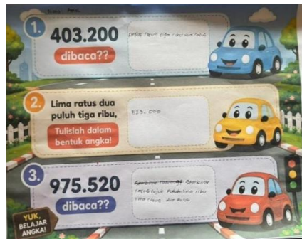
Gambar 1. Hasil Soal Siswa A

pemahaman siswa, serta melakukan bimbingan individu maupun dalam kelompok kecil bagi siswa yang mengalami kesulitan. Guru menyatakan bahwa pendekatan ini dilakukan agar siswa dapat memperoleh perhatian lebih dan memahami materi secara lebih mendalam. Di sisi lain, siswa juga menunjukkan upaya mandiri dalam mengatasi kesulitan belajar, seperti bertanya kepada guru atau teman ketika mengalami kesulitan, serta mengulang kembali pembelajaran di rumah. Hal ini menunjukkan adanya interaksi antara usaha guru dan siswa dalam mengatasi hambatan pembelajaran yang terjadi.