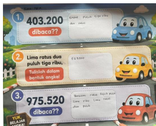
Gambar 3 Hasil Soal Siswa C

Pada soal kedua, siswa B diminta menuliskan kalimat bilangan “lima ratus dua puluh tiga ribu” ke dalam bentuk angka. Siswa B dapat menjawab dengan benar yaitu 523.000. Jawaban tersebut menunjukkan bahwa siswa B telah memahami hubungan antara bentuk kata dan simbol angka dengan baik. Selanjutnya, pada soal ketiga siswa B diminta membaca bilangan 975.520 dalam bentuk kata. Siswa B mampu menuliskan jawaban “sembilan ratus tujuh puluh lima ribu lima ratus dua puluh” dengan benar dan sesuai nilai tempat. Hasil ini menunjukkan bahwa siswa B sudah memiliki pemahaman yang cukup baik terhadap konsep bilangan cacah besar, meskipun masih terdapat beberapa kekeliruan pada soal tertentu. Secara keseluruhan, kemampuan siswa B dalam membaca dan menulis bilangan besar sudah berkembang, namun masih diperlukan latihan yang lebih terarah terutama dalam memahami nilai tempat pada bilangan yang memiliki angka nol.