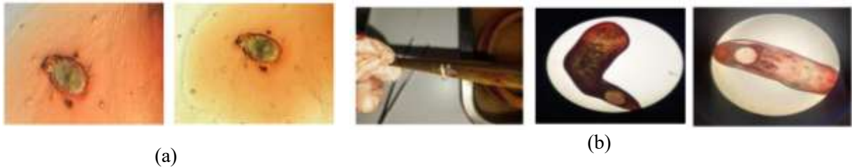
Gambar 1 (a) Ornithodoros sp. pada kerokan kulit belut sawah ( Monopterus albus ) (b) Clinostomum sp. pada kulit belut sawah ( Monopterus albus )