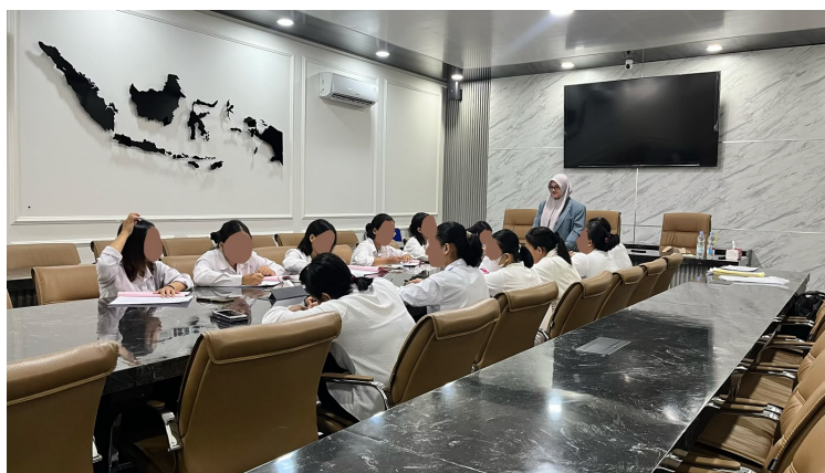
Gambar 1. Pelaksanaan asesmen psikologis CPMI offline

Pelaksanaan kegiatan asesmen dilakukan secara hybrid yakni offline dan online guna menyesuaikan kebutuhan cabang serta efektivitas pelaksanaan kegiatan. Sistem ini membantu proses pelaksanaan asesmen menjadi lebih fleksibel, waktu yang digunakan lebih efisien, dan mampu menjangkau peserta dari berbagai wilayah Indonesia. Sejalan dengan penelitian (Diantoro & Kharunnisa, 2025) yang menyatakan penggunaan sistem psikotes online membantu meningkatkan fleksibilitas pelaksanaan asesmen, mempercepat pengolahan hasil tes, serta membantu efisiensi proses administrasi asesmen psikologis. Pelaksanaan asesmen dengan berbasis hybrid menunjukkan adanya adaptasi layanan psikologi terhadap perkembangan teknologi digital. Digitalisasi layanan asesmen psikologis membantu proses administrasi, dokumentasi hasil tes, dan meningkatkan efisiensi pelaksanaan asesmen di berbagai wilayah (Mulyanto, 2025). Sistem online sangat membantu fleksibilitas, namun pelaksanaan secara online tetap memerlukan pengawasan dan pendampingan agar proses pengerjaan tes dapat berjalan sesuai prosedur.