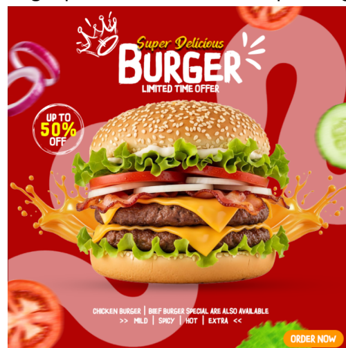
Gambar 5. Hasil Pelatihan Digital Imaging

Produk luaran kegiatan berupa karya fotografi produk hasil praktik peserta yang telah melalui proses digital imaging menggunakan Adobe Photoshop. Hasil karya tersebut meliputi foto produk makanan, minuman, dan kerajinan sederhana dengan kualitas visual yang lebih profesional. Beberapa karya peserta menunjukkan peningkatan kreativitas dalam pengolahan visual, seperti penggunaan efek blur background, manipulasi pencahayaan, penyesuaian tone warna, penghilangan objek pengganggu, hingga penambahan elemen desain pendukung promosi media sosial. Hasil tersebut menunjukkan bahwa peserta tidak hanya memahami teori, tetapi juga mampu mengimplementasikan keterampilan digital imaging secara mandiri.