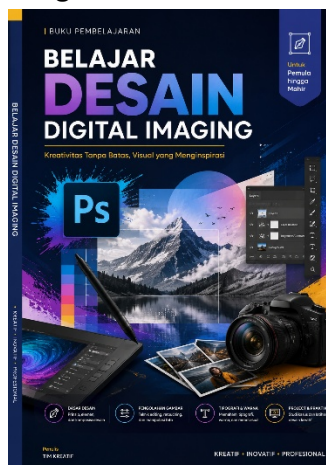
Gambar 6. Modul Pelatihan

kualitas visual hasil foto produk yang dihasilkan setelah pelatihan. Keberhasilan kegiatan juga ditunjukkan melalui kemampuan peserta dalam menghasilkan konten promosi visual secara mandiri yang lebih menarik, komunikatif, dan memiliki nilai branding yang lebih kuat dibandingkan sebelum pelatihan. Selain itu, kegiatan ini menghasilkan luaran berupa modul pembelajaran digital imaging yang dirancang sebagai bahan ajar praktik bagi siswa dan guru pendamping dalam mempelajari teknik fotografi produk dan pengolahan visual digital secara berkelanjutan. Modul tersebut diharapkan dapat menjadi media pendukung pembelajaran vokasi yang aplikatif serta membantu proses transfer pengetahuan dan keterampilan di lingkungan sekolah. Dengan demikian, kegiatan pengabdian ini memberikan kontribusi positif dalam meningkatkan kompetensi siswa SMK Pelita Pesawaran agar lebih siap menghadapi kebutuhan industri kreatif berbasis digital.