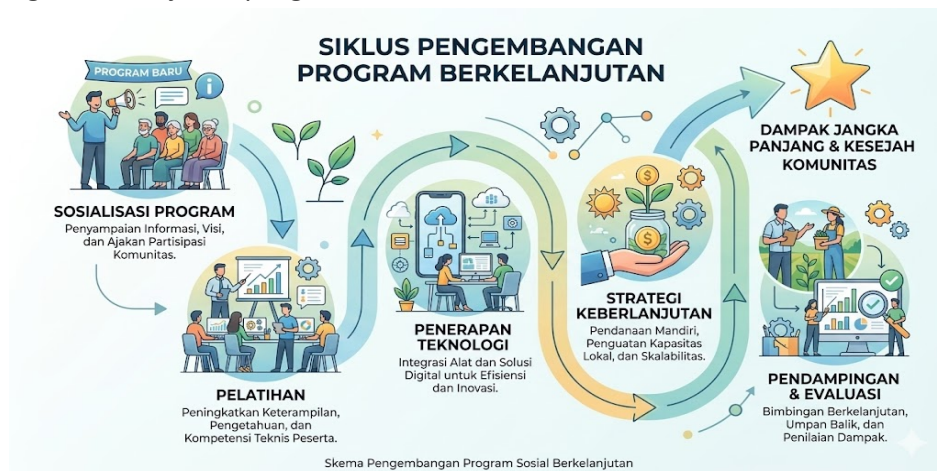
Gambar 1. Tahapan Pelaksanaan Kegiatan Pengabdian

Metode pelaksanaan kegiatan pengabdian kepada masyarakat ini dirancang secara sistematis dan partisipatif dengan melibatkan secara aktif mitra sasaran yaitu SMK Pelita Pesawaran. Pendekatan yang digunakan menekankan pada kombinasi antara transfer pengetahuan, peningkatan keterampilan praktis, serta pendampingan berkelanjutan agar solusi yang ditawarkan dapat diimplementasikan secara efektif dan berkelanjutan. Secara umum, metode pelaksanaan kegiatan ini dilaksanakan melalui beberapa tahapan utama yang meliputi sosialisasi program, pelatihan, penerapan teknologi, pendampingan dan evaluasi, serta strategi keberlanjutan program.