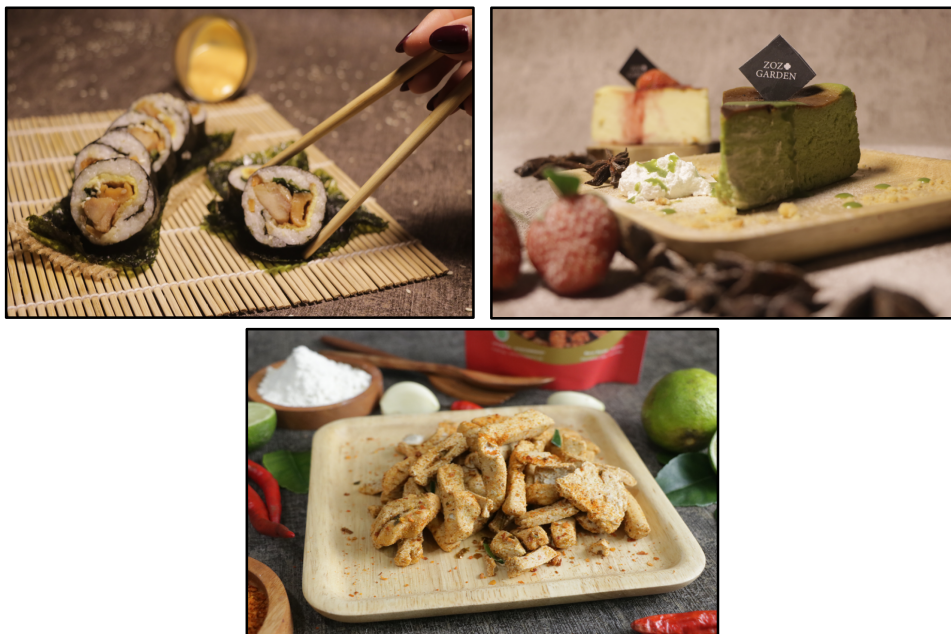
Gambar 3. Hasil Karya Peserta

Setelah pelaksanaan pelatihan dan pendampingan, terjadi peningkatan kemampuan peserta dalam memahami proses fotografi produk secara menyeluruh, mulai dari pengambilan gambar hingga tahap digital imaging. Peserta mulai mampu mengatur pencahayaan menggunakan sumber cahaya alami maupun buatan, menentukan komposisi objek yang lebih proporsional, serta memilih sudut pengambilan gambar yang mampu memperkuat karakter produk. Perubahan keterampilan tersebut terlihat dari hasil karya peserta yang menunjukkan kualitas visual lebih baik dibandingkan sebelum pelatihan, baik dari aspek ketajaman gambar, harmonisasi warna, maupun penempatan elemen visual yang mendukung identitas produk.