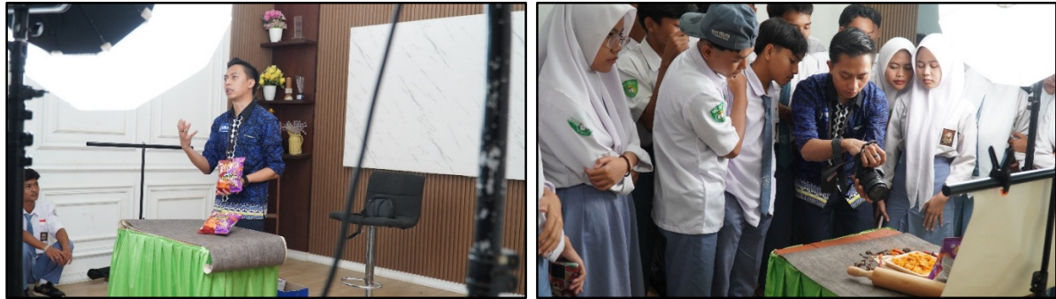
Gambar 2. Pelatihan dan pendampingan

Setelah pelaksanaan pelatihan dan pendampingan, terjadi peningkatan kemampuan peserta dalam memahami proses fotografi produk secara menyeluruh, mulai dari pengambilan gambar hingga tahap digital imaging. Peserta mulai mampu mengatur pencahayaan menggunakan sumber cahaya alami maupun buatan, menentukan komposisi objek yang lebih proporsional, serta memilih sudut pengambilan gambar yang mampu memperkuat karakter produk. Perubahan keterampilan tersebut terlihat dari hasil karya peserta yang menunjukkan kualitas visual lebih baik dibandingkan sebelum pelatihan, baik dari aspek ketajaman gambar, harmonisasi warna, maupun penempatan elemen visual yang mendukung identitas produk.