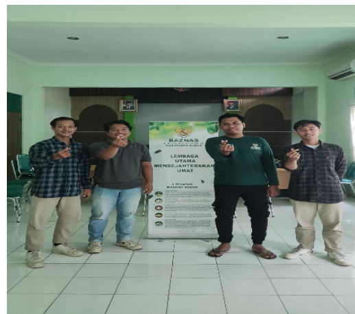
Gambar. 2 Dokumentasi dengan penyelia