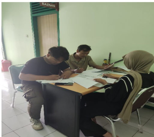
Gambar. 1 Dokumentasi saat magang

Sebagai tindak lanjut dari arahan dosen pembimbing, sistem logbook dan absensi online juga mulai memasukkan aturan kedisiplinan selama magang. Peserta diwajibkan melakukan absen langsung di kantor setiap hari kerja menggunakan fitur presensi digital yang terhubung dengan lokasi. Sistem ini sekaligus mencatat waktu kedatangan untuk memantau ketepatan waktu. Bagi peserta yang mengalami keterlambatan lebih dari 15 menit, sistem akan memberikan tanda peringatan otomatis pada rekap kehadiran. Jika keterlambatan terjadi sebanyak tiga kali, peserta menerima sanksi berupa teguran tertulis dan wajib mengisi laporan evaluasi kedisiplinan. Aturan ini diterapkan untuk mendukung pembinaan karakter dan memastikan kegiatan magang berjalan sesuai standar profesionalitas. Selain itu, peserta juga mulai menerapkan aturan baru terkait dokumentasi kegiatan, yaitu kewajiban untuk mengambil foto bersama pihak yang disurvei pada setiap sesi observasi atau wawancara. Aturan ini membantu meningkatkan validitas data lapangan serta mempermudah pembimbing dalam memverifikasi proses pengumpulan data secara langsung. Pengguna sistem menerima aturan ini sebagai bagian dari standar dokumentasi kegiatan magang.