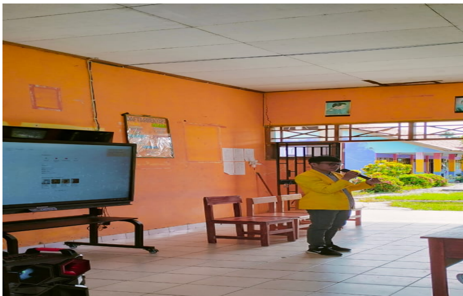
Gambar 1: Pelaksanaan Pelatihan Teknik Vokal

Kegiatan pelatihan teknik vokal dilaksanakan pada tiga tahap (1). Perencanaan dilaksanakan pada tanggal 05 Januari sampai 16 Januari (2). Persiapan dilaksanakan pada hari Rabu, 17 Januari 2024 dan Kamis, 18 Januari 2024. Persiapan meliputi penyusunan materi, jadwal pelaksanaan, persiapan perlengkapan dan lembar pengamatan. (2). Pelaksanaan dilaksanakan 1 (satu) kali pada setiap sekolah yaitu Rabu, 17 Januari 2024 dilaksanakan di SMKN 1 Luwu Utara dan SMAN 4 Luwu Utara dan Kamis, 18 Januari 2024 dilaksanakan di SMAN 12 Luwu utara.